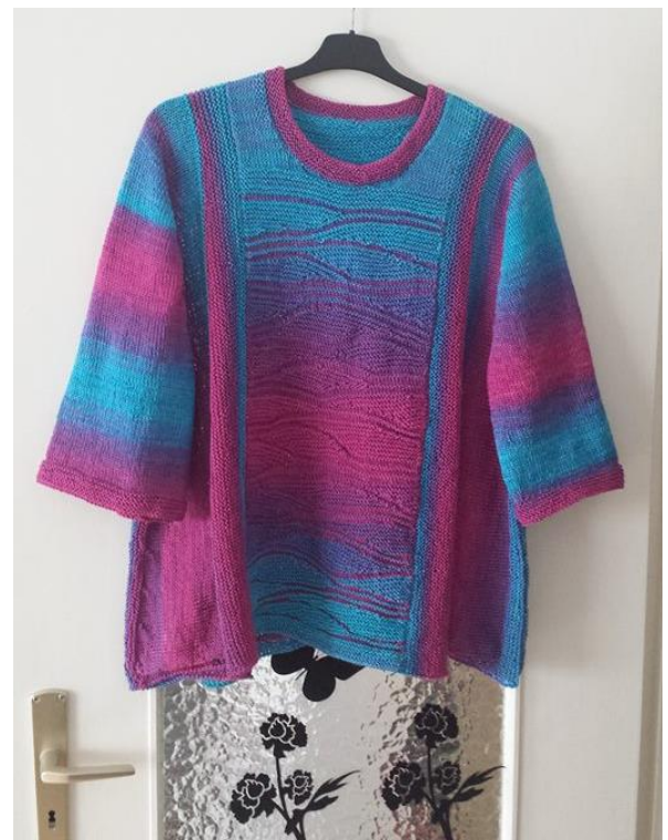
Fit for Fun Pullover, von Petra Buschhoff nach dem Kurs gestrickt